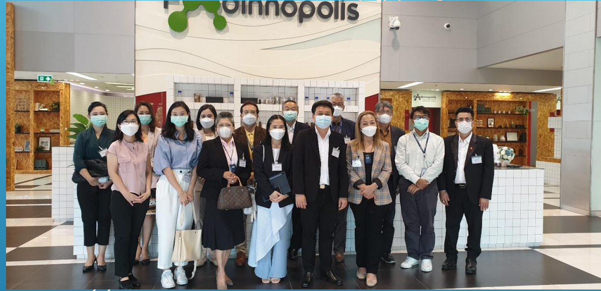
การเยี่ยมชมและการสร้างความร่วมมือกับศูนย์นวัตกรรมเมืองอาหาร (Food Innopolis)