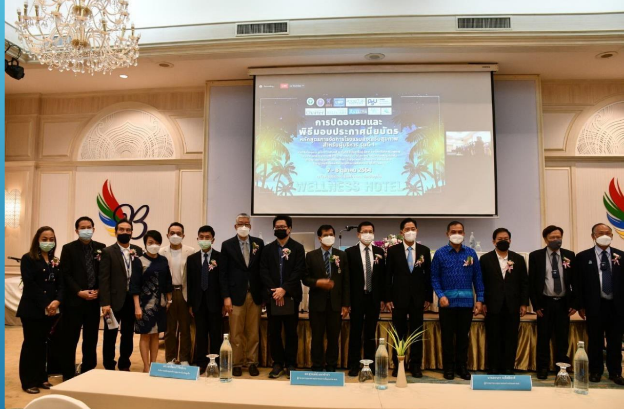
การเปิดหลักสูตรอบรมการจัดการโรงแรมส่งเสริมสุขภาพสำหรับผู้บริหาร มหาวิทยาลัยสงขลานครินทร์