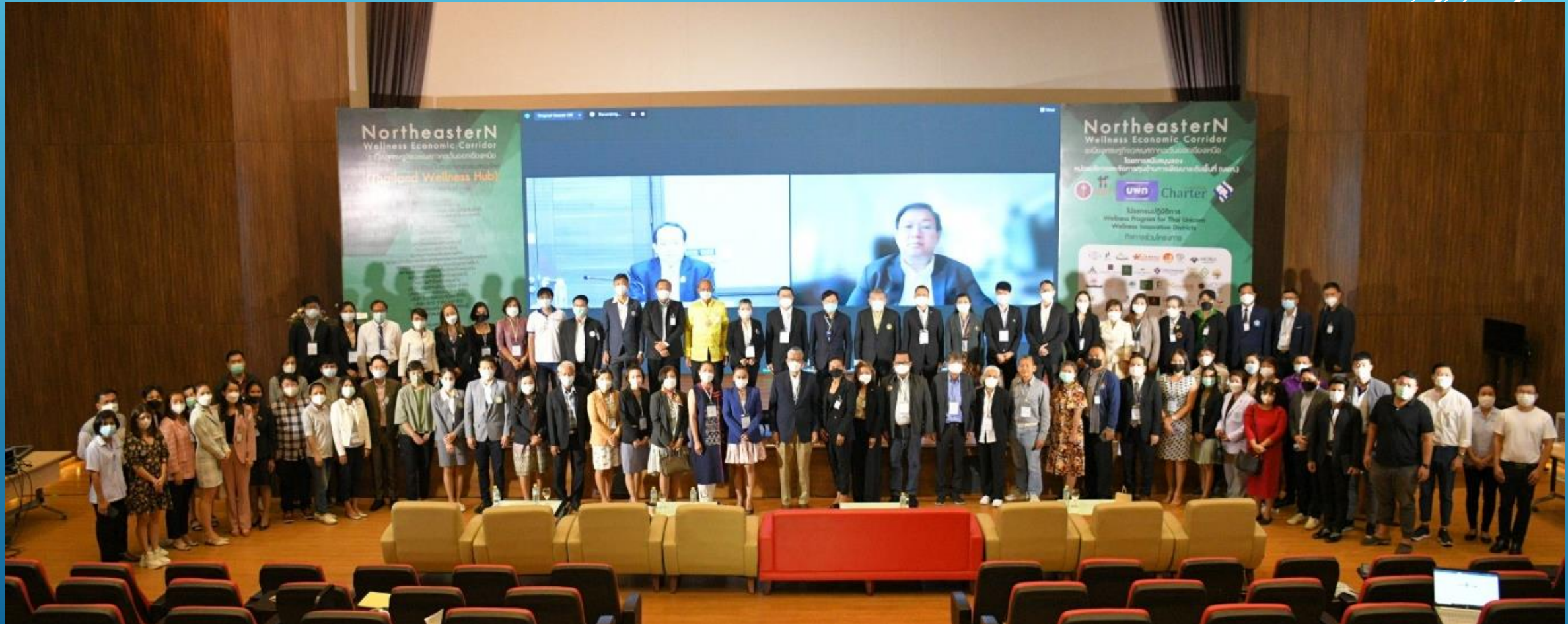
การประชุมใหญ่เปิดระเบียงเศรษฐกิจภาคตะวันออกเฉียงเหนือ ณ อุทยานวิทยาศาสตร์ ภาคตะวันออกเฉียงเหนือ มหาวิทยาลัยขอนแก่น