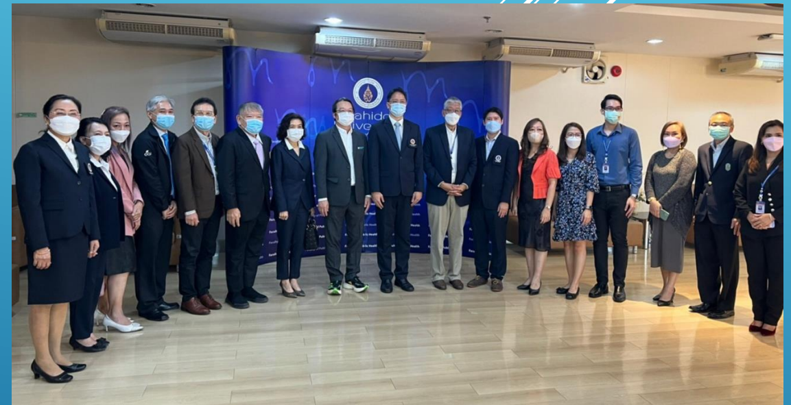
การประชุมประสานแผนการพัฒนาระบบปรับปรุงเมนูอาหาร กับคณะสาธารณสุขศาสตร์ มหาวิทยาลัยมหิดล