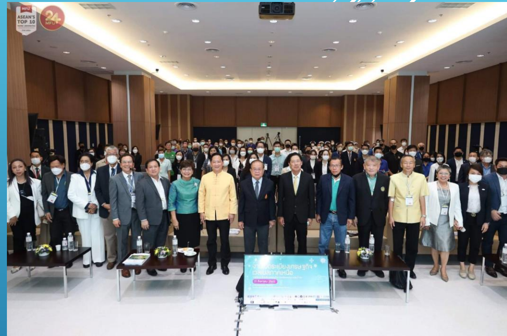
การประชุมใหญ่เปิดระเบียบเศรษฐกิจเวลเนสภาคเหนือ ณ.มหาวิทยาลัยแม่ฟ้าหลวง