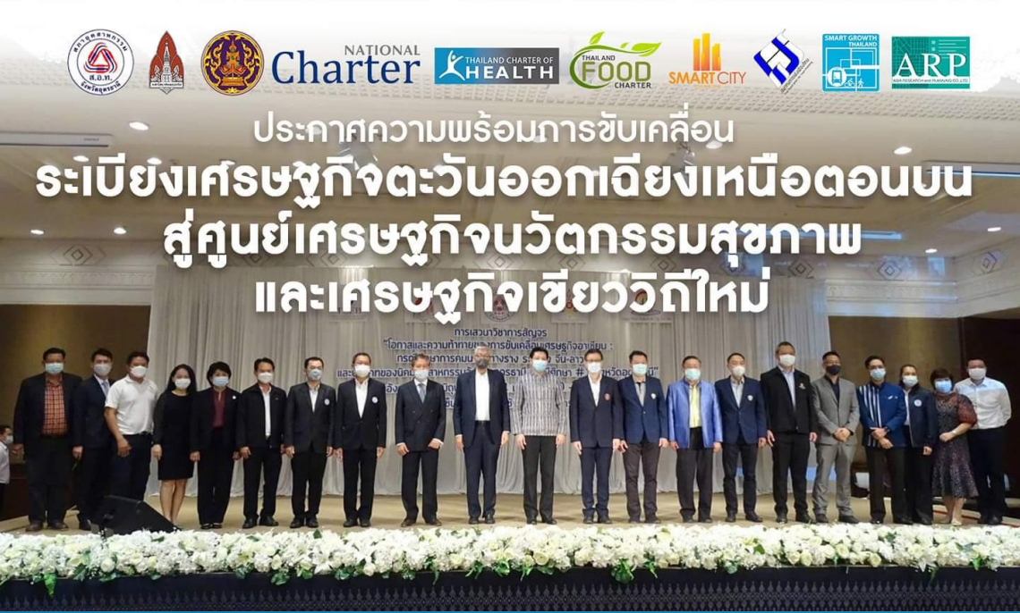
การเปิดระเบียบเศรษฐกิจเวลเนสอุดรธานี โดยผู้ว่าราชการจังหวัดอุดรธานี