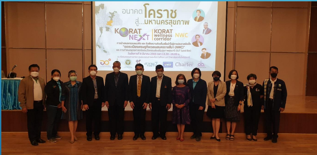
การประชุมประสานแผนการพัฒนานวัตกรรมกับ มหาวิทยาลัยเทคโนโลยีสุรนารี จังหวัดนครราชสีมา