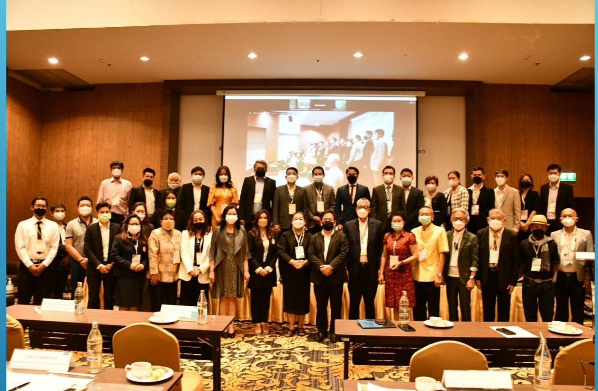
การประกาศความพร้อมการพัฒนายระเบียบเศรษฐกิจเวลเนสภาคกลาง