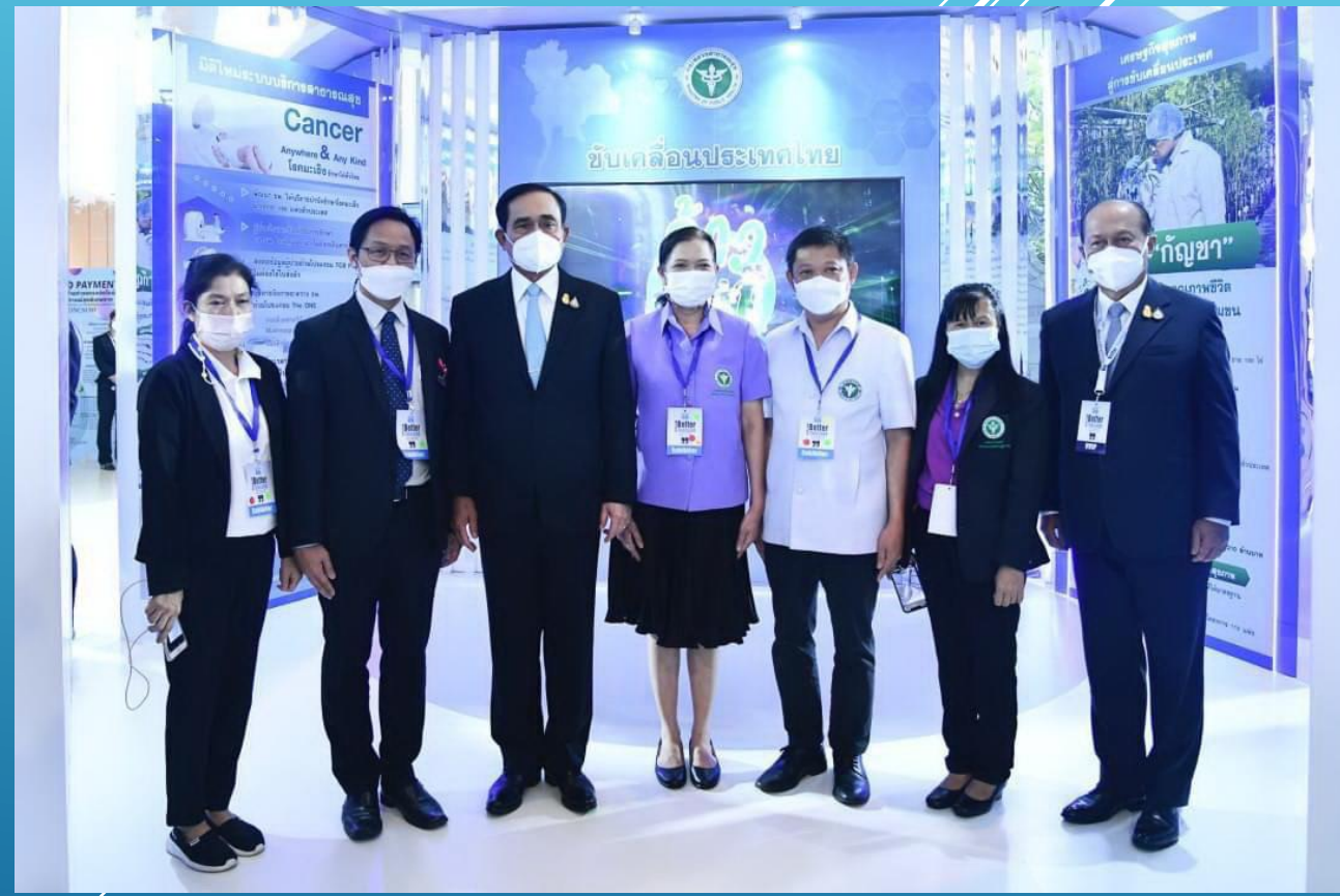
นิทรรศการของกระทรวงสาธารณสุขที่จัดแสดงระเบียบเศรษฐกิจอาเซียนสประเทศไทยและระเบียบเศรษฐกิจอาเซียนอันดามัน ในงาน Thailand International Health Expo 2022