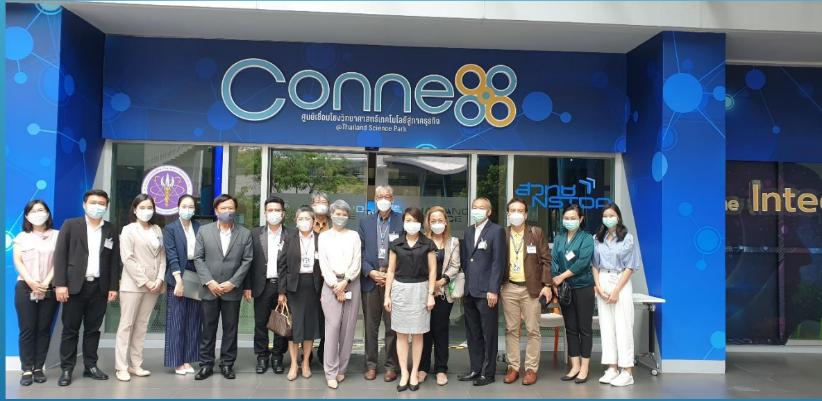
การเยี่ยมชมการสาธิตผลิตภัณฑ์และการสร้างความร่วมมือกับ สวทช.