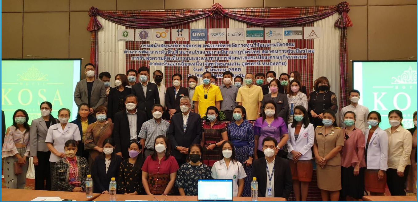
การประชุมรับฟังความคิดเห็นการพัฒนาระเบียงเศรษฐกิจเวลเนสภาคตะวันออกเฉียงเหนือ ณ.โรงแรมโซ่จันทน์ จังหวัดขอนแก่น