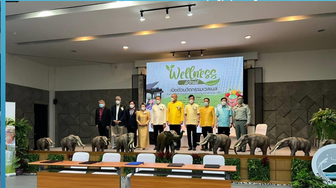
การประชุมการพัฒนาระเบียบเศรษฐกิจอาเซียนสภาคจังหวัดนครราชสีมา โรงแรมเดอะเปียร์โน รีสอร์ท เขาใหญ่ โดย พลเอกพรเทพ หนูเทพ องคมนตรี