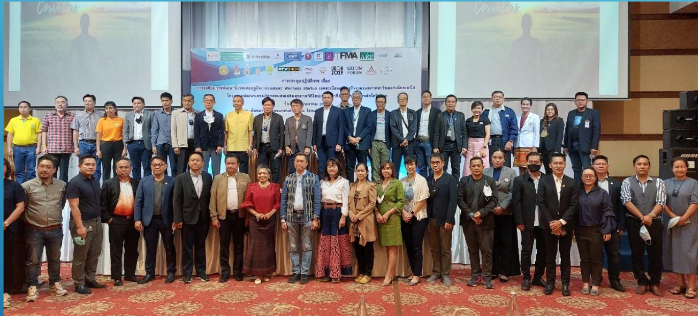
การประชุมรอบการพัฒนาระเบียบเศรษฐกิจภาคตะวันออกเฉียงเหนือ โรงแรมโซะ จังหวัดขอนแก่น