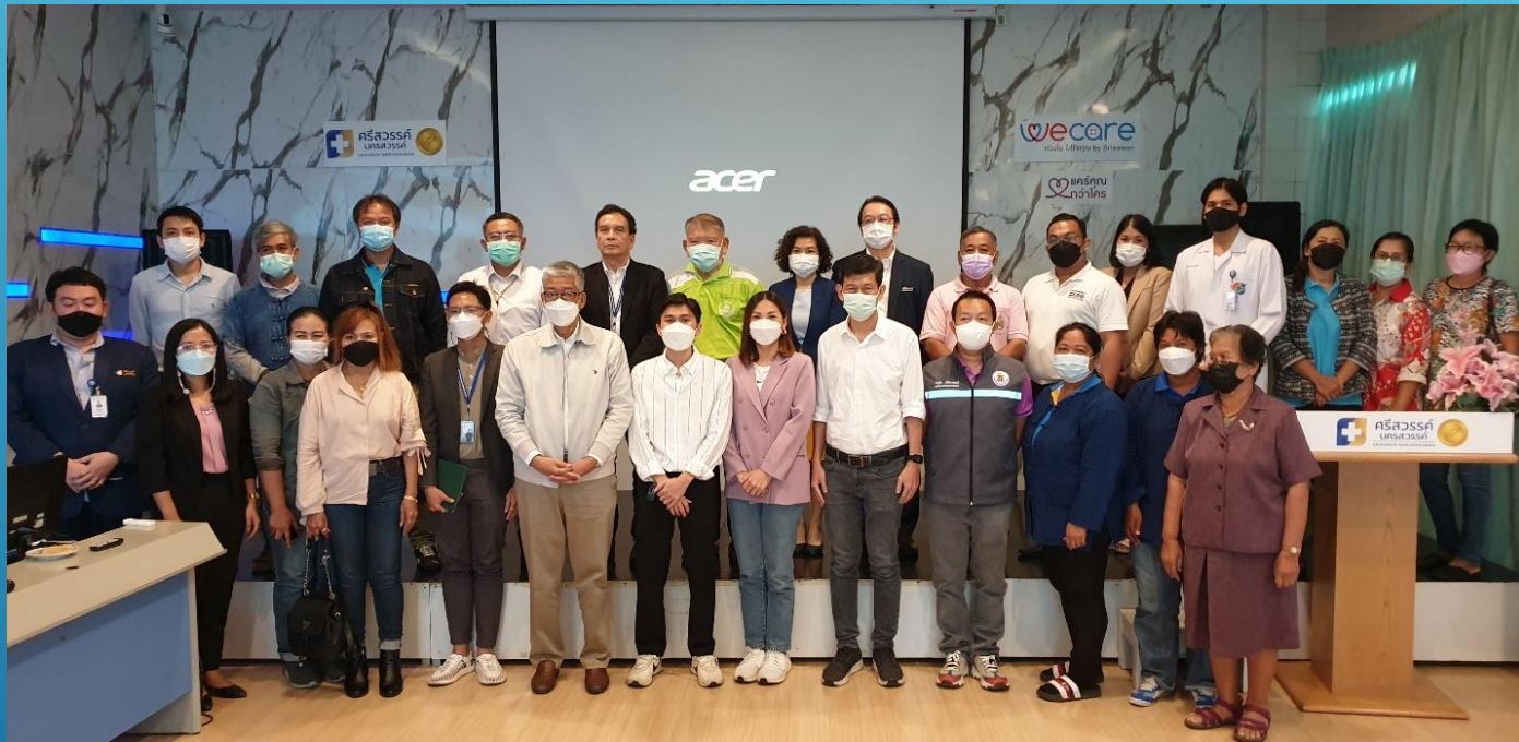
การประชุมเตรียมการพัฒนาระเบียงเศรษฐกิจเวลเนสจังหวัดนครสวรรค์ ณ.โรงพยาบาลศิริสวรรค์ จังหวัดนครสวรรค์