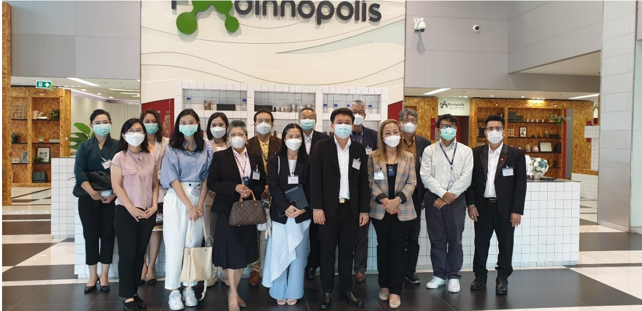
ภาพที่ 30 การเยี่ยมชมและการสร้างความร่วมมือกับศูนย์นวัตกรรมเมืองอาหาร (Food Innopolis)