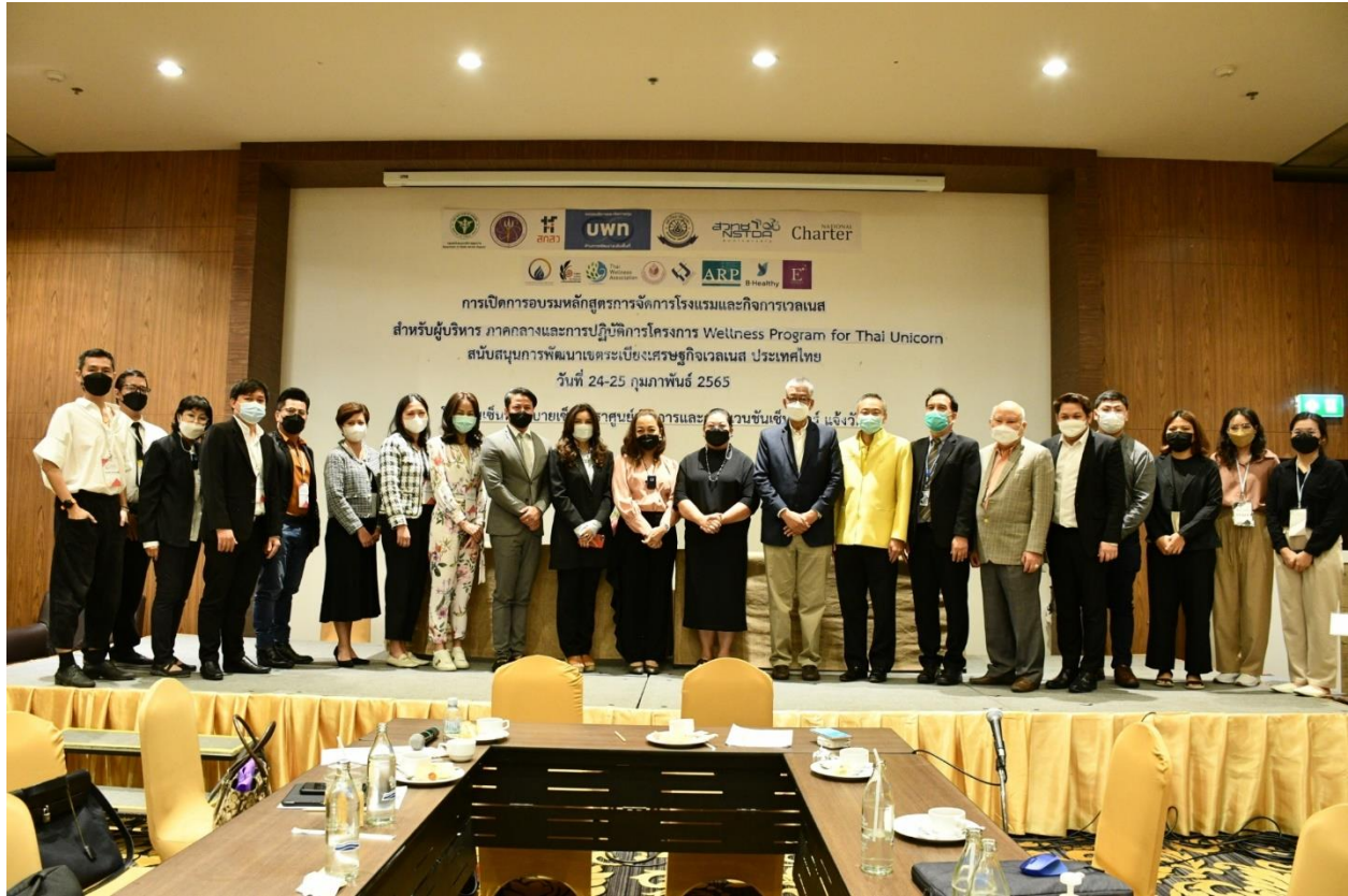
ภาพที่ 14 ภาพการอบรมสนับสนุนการพัฒนาระเบียงเศรษฐกิจเวลเนสประเทศไทย โรงแรมเซนทารา บายเซนทารา ศูนย์ราชการแจ้งวัฒนะ กรุงเทพมหานคร