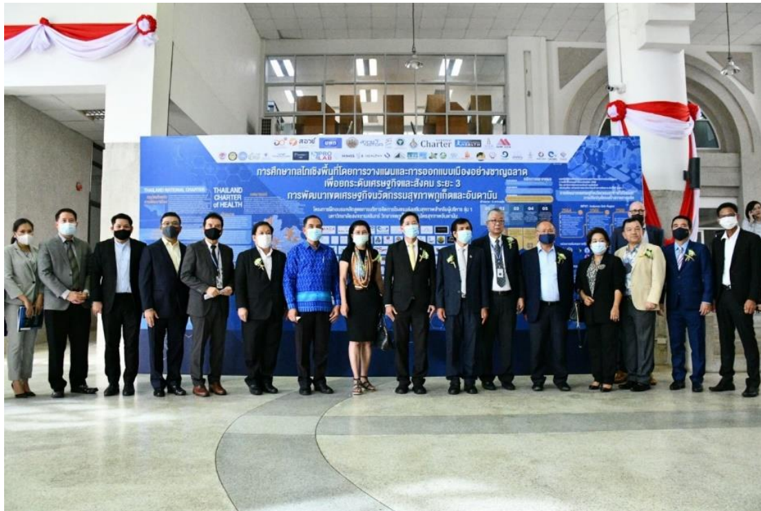
ภาพที่ 1 ภาพพิธีกรรมสนับสนุนบริการสุขภาพเป็นประธานในการเปิดหลักสูตรอบรมการจัดการโรงแรมส่งเสริมสุขภาพสำหรับผู้บริหาร มหาวิทยาลัยสงขลานครินทร์

นับจากการระบาดของโควิด 19 กรมสนับสนุนบริการสุขภาพและเครือข่ายพันธมิตร ประกอบด้วย มหาวิทยาลัยสงขลานครินทร์ สำนักงานพัฒนาวิทยาศาสตร์และเทคโนโลยีแห่งชาติ คณะกรรมการกฤษฎีกาไทย สมาคมการผังเมืองไทย สมาคมโรงแรมที่พักส่งเสริมสุขภาพอันดามันและอ่าวไทย และสมาคมการส่งเสริมสุขภาพไทย ได้ร่วมกันพัฒนานโยบายการปรับเปลี่ยนโครงสร้างภาคการผลิตของโรงแรมให้เป็นกิจการwelnessมาตรฐานหรือโรงแรมส่งเสริมสุขภาพ (Wellness Hotel) โดยเปิดหลักสูตรการอบรมการจัดการโรงแรมส่งเสริมสุขภาพสำหรับผู้บริหาร (Wellness Hotel for Executive) ณ.วิทยาเขตภูเก็ตของมหาวิทยาลัยสงขลานครินทร์ ซึ่งมีโรงแรมได้ผ่านการอบรมจำนวน 111 แห่ง จากการสำรวจของมหาวิทยาลัยสงขลานครินทร์พบว่าโรงแรมร้อยละ 20 ได้ดำเนินการปรับปรุงเป็นโรงแรมส่งเสริมสุขภาพทันทีและร้อยละ 45 อยู่ระหว่างการเตรียมการปรับปรุง