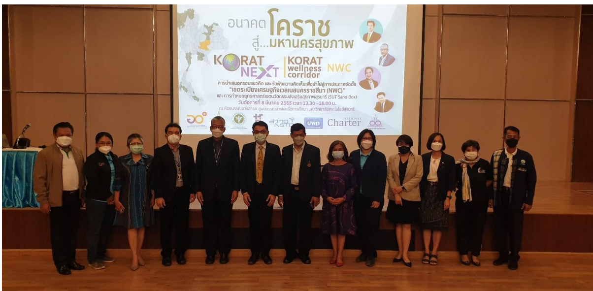
ภาพที่ 27 การประชุมประสานแผนการพัฒนานวัตกรรมกับมหาวิทยาลัยเทคโนโลยีสุรนารี จังหวัดนครราชสีมา

โครงการฯ ได้ประสานงานกับมหาวิทยาลัย อุทยานวิทยาศาสตร์ และสำนักงานพัฒนาวิทยาศาสตร์และเทคโนโลยีแห่งชาติอย่างใกล้ชิด โดยได้รับความร่วมมือในการสนับสนุนผู้เชี่ยวชาญ นวัตกรรม และผลิตภัณฑ์หรือบริการที่สามารถสนับสนุนการพัฒนานิเวศของเวเลนส์ให้มีความสมบูรณ์ ช่วยยกระดับขีดความสามารถการแข่งขันในระดับกิจการและระดับของประเทศได้