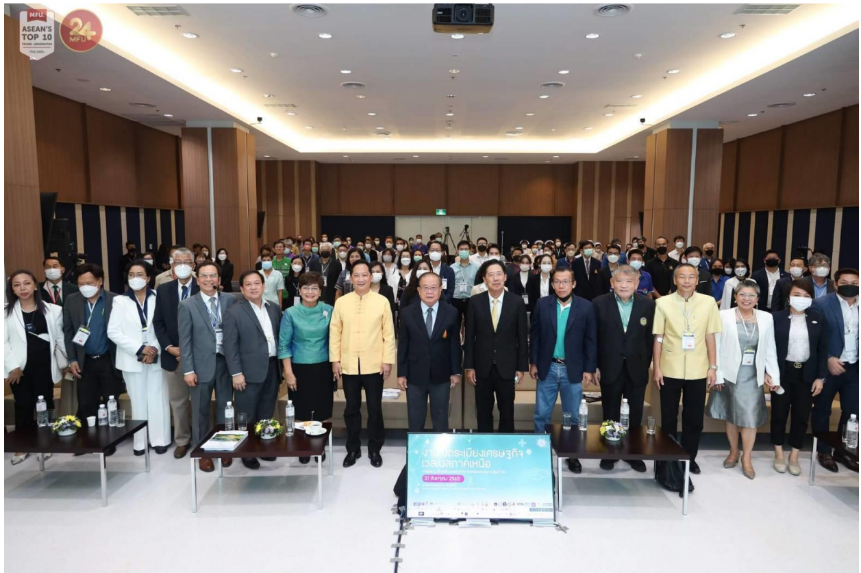
ภาพที่ 22 การประชุมใหญ่เปิดระเบียงเศรษฐกิจอาเซียนภาคเหนือ ณ มหาวิทยาลัยแม่ฟ้าหลวง