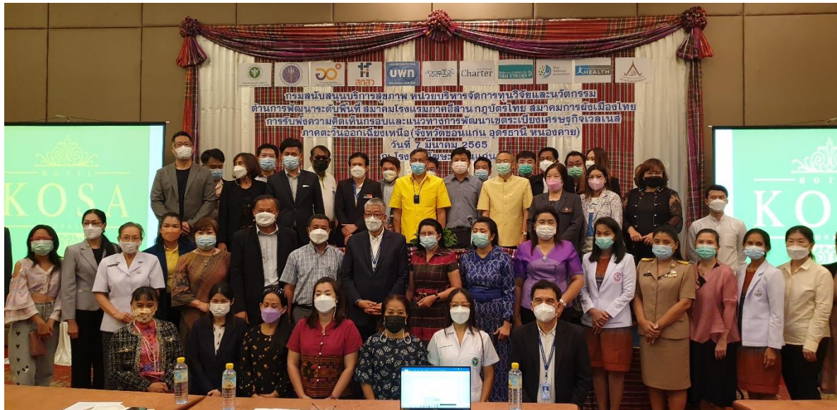
ภาพที่ 19 ภาพการประชุมรับฟังความคิดเห็นการพัฒนาระเบียงเศรษฐกิจพิเศษภาคตะวันออกจังหวัดขอนแก่น ณ โรงแรมโสมเชอร์รี่ จังหวัดขอนแก่น