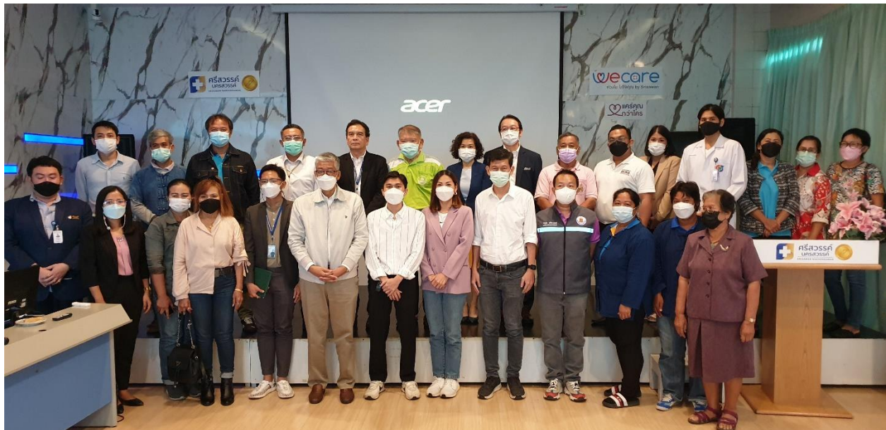
ภาพที่ 21 การประชุมเตรียมการพัฒนาระเบียงเศรษฐกิจเวลเนสจังหวัดนครสวรรค์ ณ.โรงพยาบาลศรีสวรรค์ จังหวัดนครสวรรค์