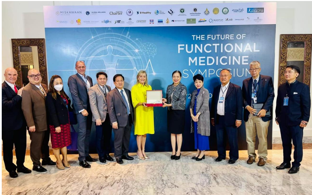
ภาพที่ 25 ผู้อำนวยการกองสุขภาพระหว่างประเทศ กรมสนับสนุนบริการสุขภาพหรือความร่วมมือกับผู้บริหาร GWS พร้อมมอบของที่ระลึก ในงานประชุม Functional Medicine Symposium ที่จัดขึ้นในประเทศไทย

โครงการฯ ได้ประสานกับกิจการเวชขนาดใหญ่ของไทยเพื่อสร้างความร่วมมือพัฒนาระบบนิเวศและการตลาดเวชในระยยาว เบื้องต้นได้ประสานความร่วมมือกับโครงการ forestias ในเครือ MQDC และกิจการเวช Miskawaan Health Clinic สำหรับสถาบันเวชนานาชาติ ได้ประสานความร่วมมือกับ Global Wellness Institute (GWI) ซึ่งในโอกาสต่อไป โครงการฯ จะเป็นผู้อนุสิทธิ์ในการจัดประชุม Global Wellness Summit ขึ้นในประเทศไทย