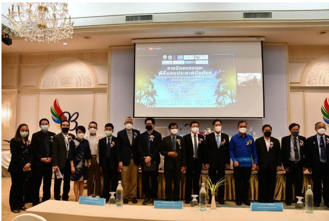
ภาพที่ 2 ภาพพิธีปิดอบรมมอบประกาศนียบัตรและปิดการอบรม