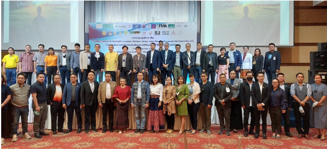
ภาพที่ 15 การประชุมกรอบการพัฒนาระเบียงเศรษฐกิจภาคตะวันออกเฉียงเหนือ โรงแรมโมชะ จังหวัดขอนแก่น

4. เครือข่ายเทคโนโลยีดิจิทัลและซัพพลายเชนด้านผลิตภัณฑ์ велเนส ประกอบด้วยบริษัท พี-เฮลท์อี เอเชีย จำกัด