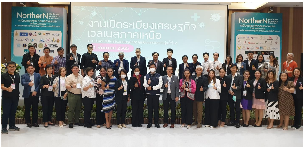
ภาพที่ 24 เครือข่ายโรงพยาบาล โรงแรม คลินิก และซัพพลายเชนเวลเนสภาคเหนือบันทึกภาพพร้อมกัน