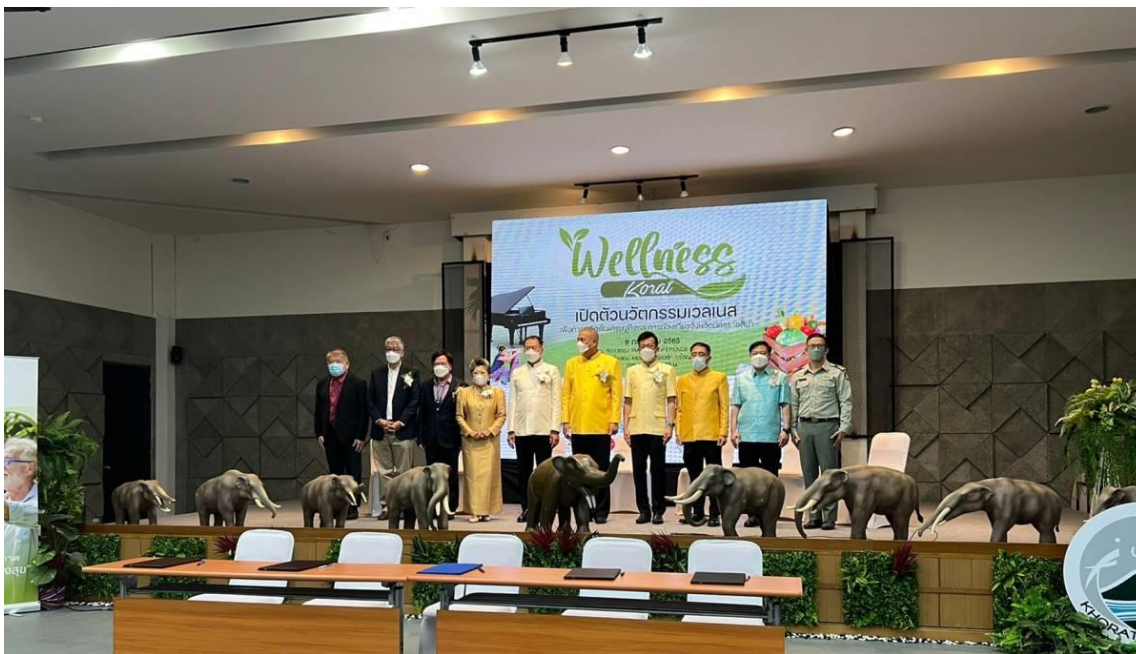
ภาพที่ 16 ภาพการประชุมการพัฒนาระเบียงเศรษฐกิจเวลเนสจังหวัดนครราชสีมา โรงแรมเดอะเปียโน รีสอร์ท เขาใหญ่ โดย พลเอกพรเทพ หนูเทพ องคมนตรี