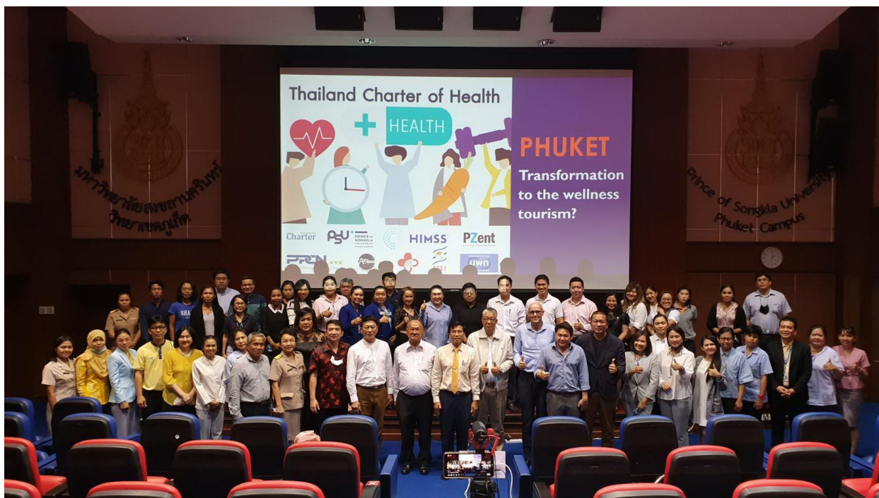
ภาพที่ 11 ภาพการประกาศการพัฒนาระเบียบเศรษฐกิจเวลเนสอันดามัน โดยมหาวิทยาลัยสงขลานครินทร์