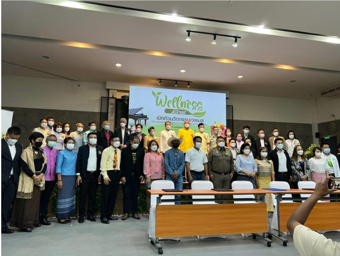
ภาพที่ 17 ภาพการประชุมการพัฒนาระเบียบเศรษฐกิจเวลเนสจังหวัดนครราชสีมา โรงแรมเดอะเปียโน เขาใหญ่