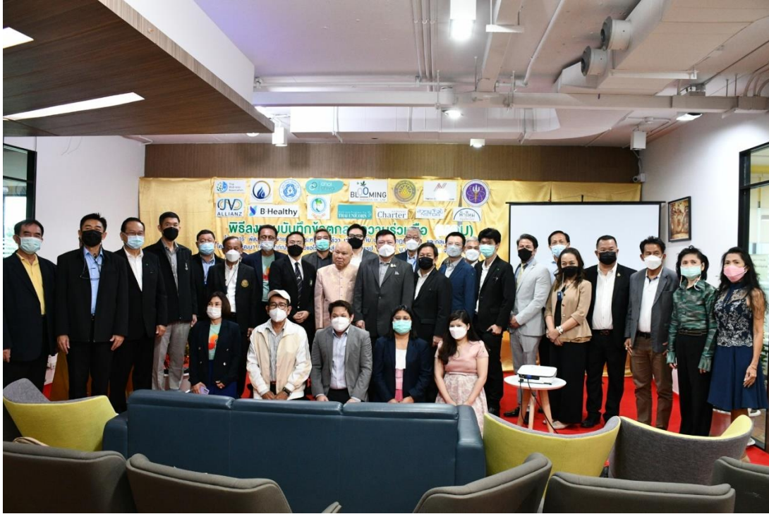
ภาพที่ 12 ภาพบันทึกความตกลงความร่วมมือระหว่างกฏบัตรไทยและเครือข่ายภาคธุรกิจในจังหวัดชลบุรี