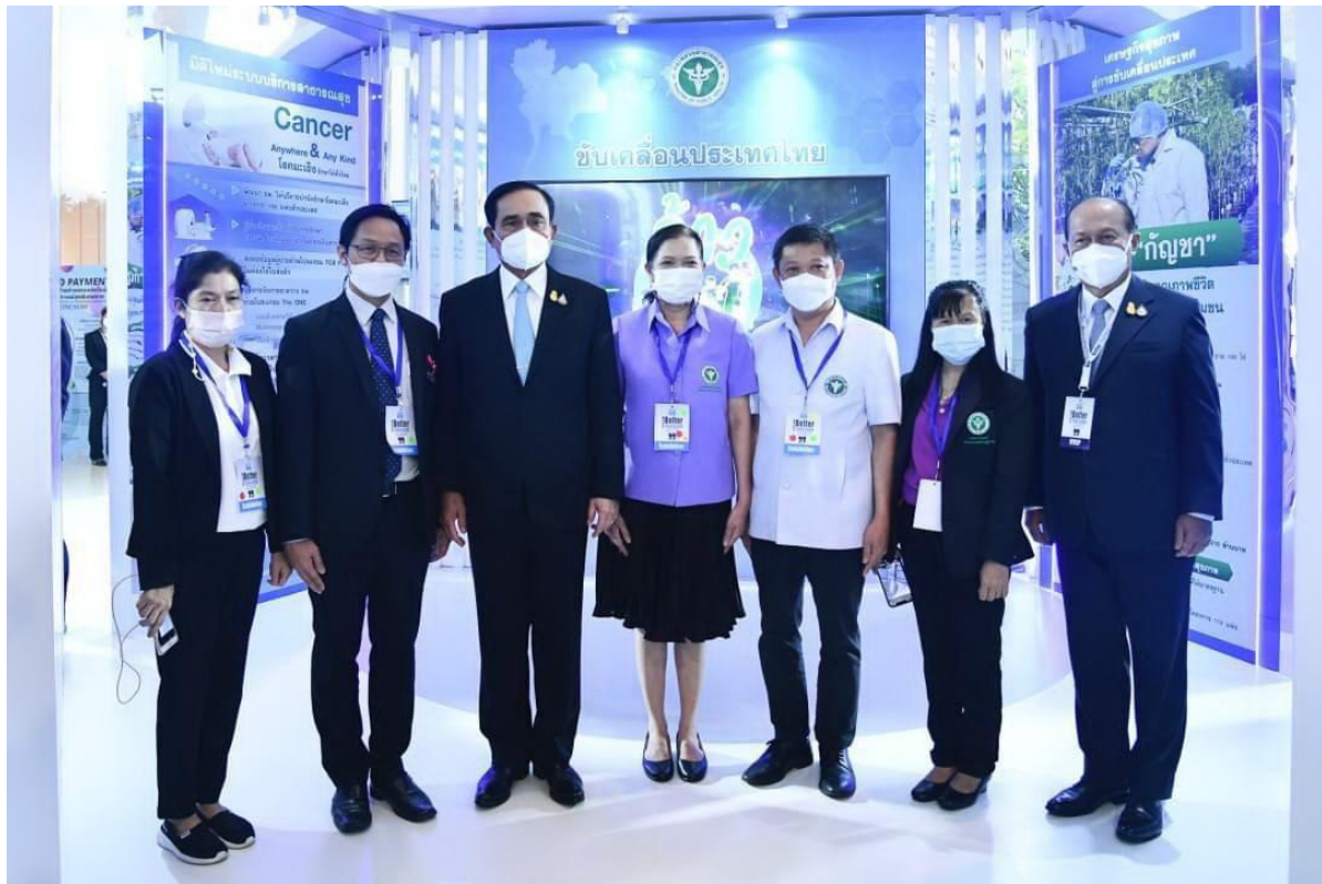
ภาพที่ 9 ภาพพลเอกประยุทธ์ จันทร์โอชา นายกรัฐมนตรีและพลเอกอนุพงษ์ เผ่าจินดา รัฐมนตรีว่าการกระทรวงมหาดไทย เยี่ยมชมนิทรรศการของกระทรวงสาธารณสุขที่จัดแสดงระเบียบเชิงเศรษฐกิจwelness ประเทศไทยและระเบียบเชิงเศรษฐกิจwelnessอันดามัน ในงาน Thailand International Health Expo 2022