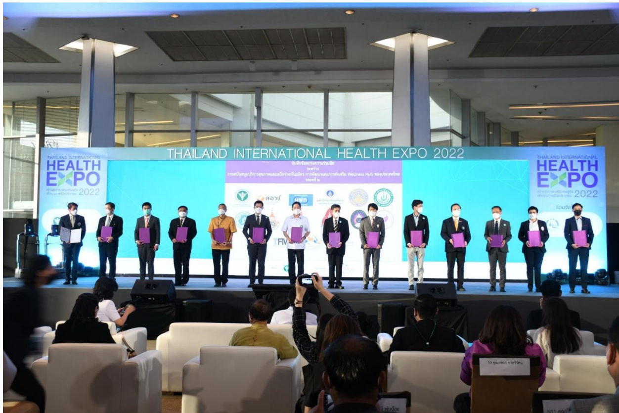
ภาพที่ 4 ภาพการลงนามความร่วมมือการพัฒนาและส่งเสริม Wellness Hub ครั้งที่ 1 รอยัลพารากอนฮอลล์ ศูนย์การค้าสยามพารากอน