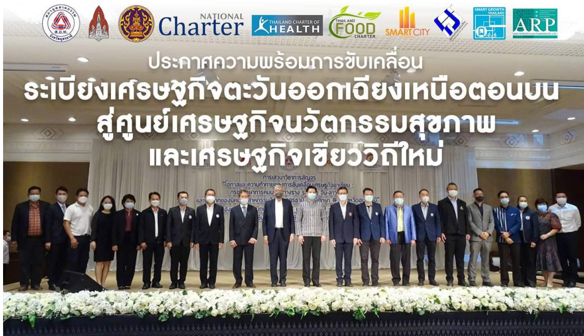
ภาพที่ 18 ภาพการเปิดระเบียบเศรษฐกิจเวลเนสอุดรธานี โดยผู้ว่าราชการจังหวัดอุดรธานี