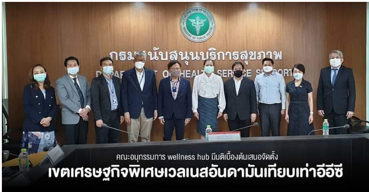
ภาพที่ 10 คณะอนุกรรมการ Wellness Hub กรมสนับสนุนบริการสุขภาพ มีมติเบื้องต้นเปิดระเบียบเศรษฐกิจเวลเนสอันดามัน