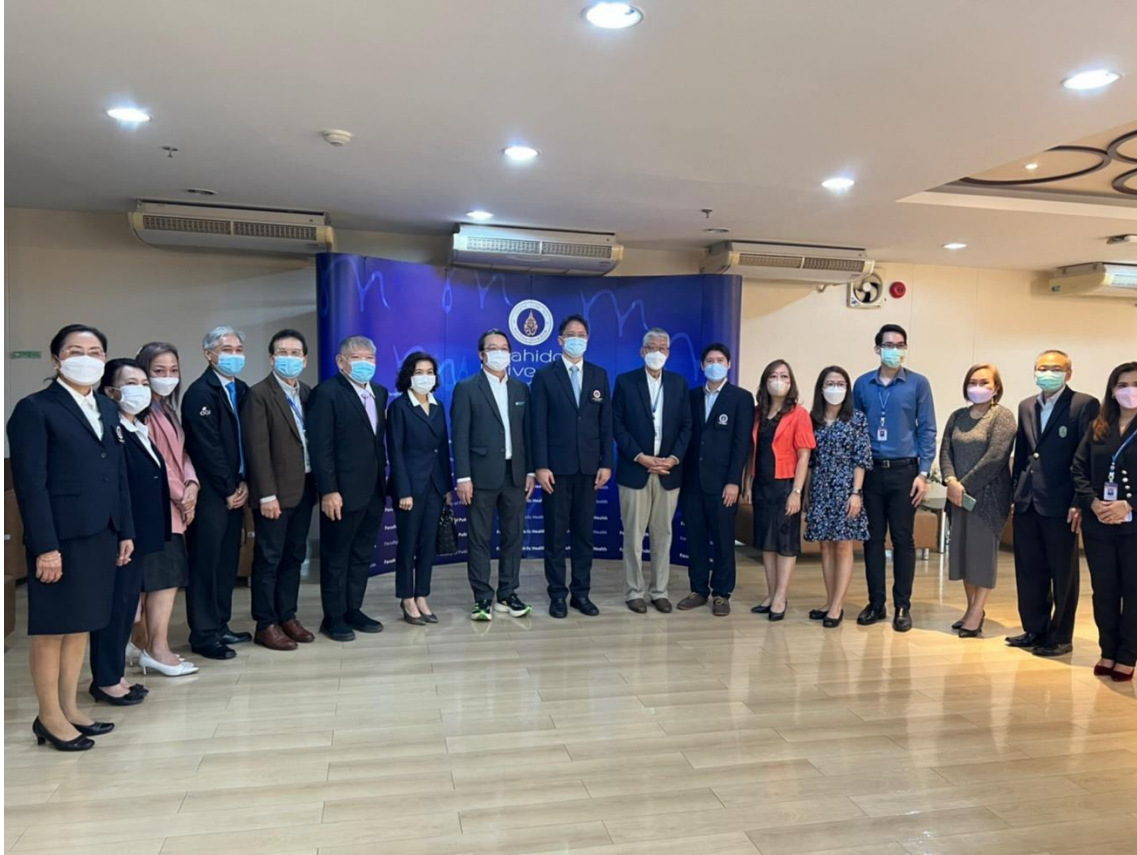
ภาพที่ 28 การประสานแผนการพัฒนาโปรแกรมปรับปรุงเมนูอาหารกับคณะสาธารณสุขศาสตร์ มหาวิทยาลัยมหิดล