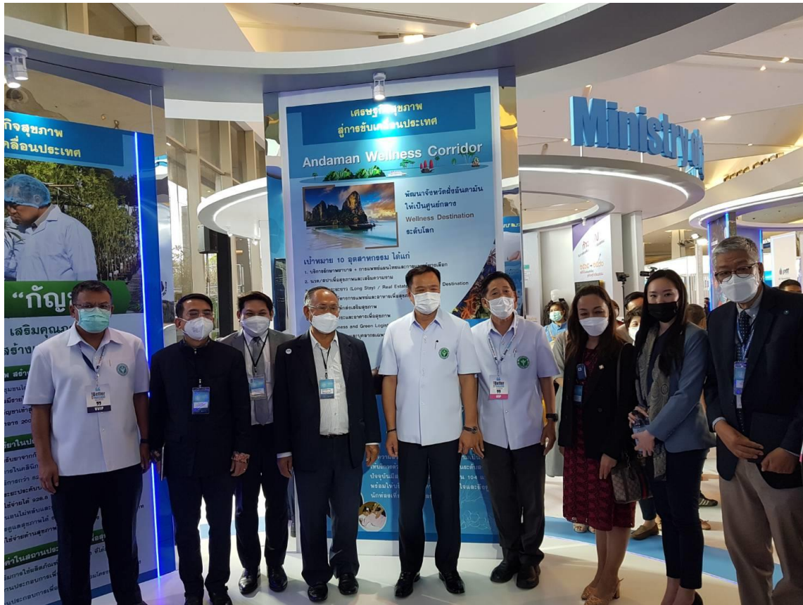
ภาพที่ 8 ภาพนายอนุทิน ชาญวีรกูล รองนายกรัฐมนตรีและรัฐมนตรีว่าการกระทรวงสาธารณสุขเยี่ยมชมนิทรรศการของกระทรวงสาธารณสุขที่จัดแสดงระเบียบเศรษฐกิจเขตเนสประเทศไทยและระเบียบเศรษฐกิจเขตเนสอันดามัน ในงาน Thailand International Health Expo 2022