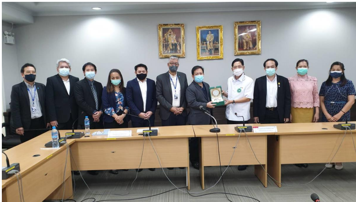
ภาพที่ 5 ภาพอธิบดีกรมสนับสนุนบริการสุขภาพให้แนวทางดำเนินงานแก่คณะทำงานขับเคลื่อนระบบนิเวศรองรับการพัฒนาอุตสาหกรรมส่งเสริมสุขภาพ

(Wellness Manager) หลักสูตร Upskill spa manager to wellness manager และหลักสูตร health coach หรือ life coach รวมทั้งหลักสูตรการยกระดับมาตรฐานการส่งเสริมสุขภาพอื่นๆ (4) เสนอแนะมาตรการในการผลักดันและสนับสนุนการพัฒนาบริการเพื่อการส่งเสริมสุขภาพให้บรรลุผลสำเร็จ รวมถึง พิจารณาสื่อแนะแนวทางวิธีการสนับสนุนระบบสิทธิประโยชน์ การแก้ไขปัญหา และอุปสรรคด้านต่างๆ ให้แก่กิจการส่งเสริมสุขภาพ (5) ให้การสนับสนุนในการประสานเครือข่ายโรงแรม กิจการส่งเสริมสุขภาพ และกิจการอุตสาหกรรมหรือกิจการบริการที่เกี่ยวข้องกับการส่งเสริมสุขภาพ เพื่อสร้างระบบนิเวศและห่วงโซ่อุปทานการส่งเสริมสุขภาพที่มีความสมบูรณ์ (6) สนับสนุน กำกับรายงานผลการดำเนินการ และติดตามการดำเนินงานต่างๆ ให้เป็นไปด้วยความเรียบร้อย และรายงานผลการดำเนินงานต่อคณะกรรมการพัฒนาประเทศไทยให้เป็นศูนย์กลางบริการเพื่อส่งเสริมสุขภาพ (Wellness Hub) ทราบ และ (7) ปฏิบัติงานอื่นๆ ตามที่ได้รับมอบหมาย