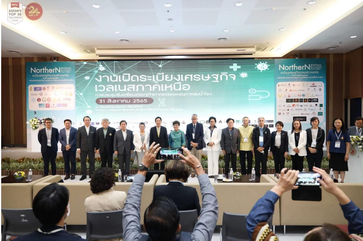
ภาพที่ 23 ภาพอธิบดีกรมสนับสนุนบริการสุขภาพและผู้ว่าราชการจังหวัดเชียงรายร่วมเปิดการประชุมใหญ่ ระเบียบเศรษฐกิจเวลเนสภาคเหนือ