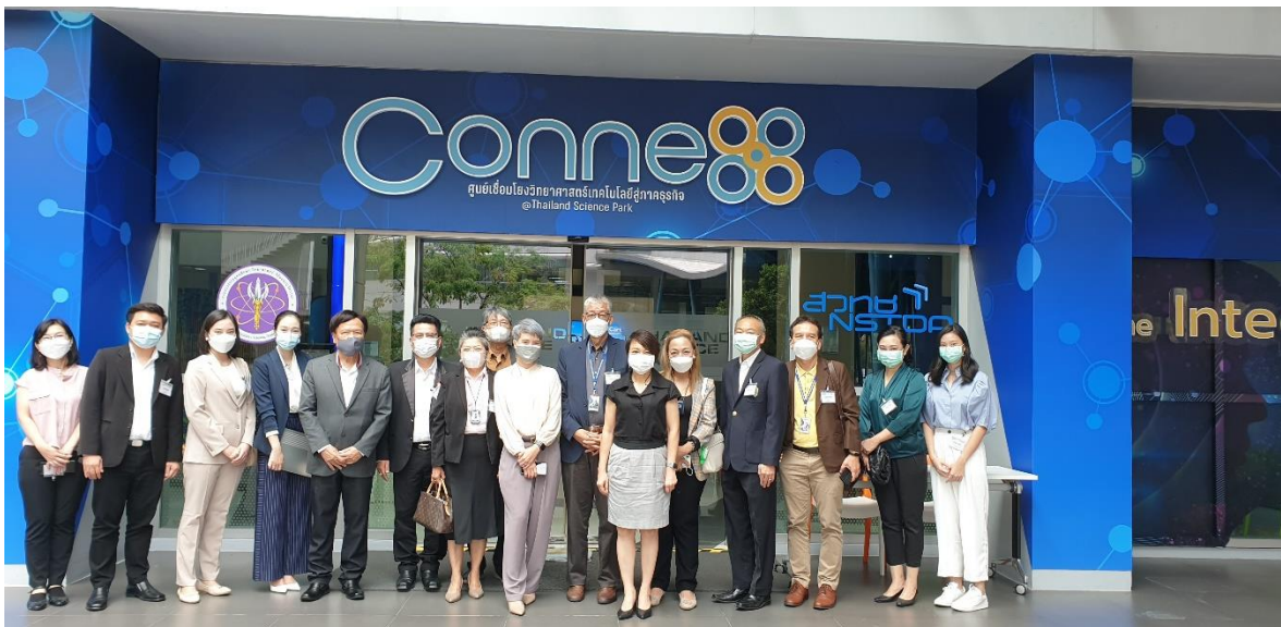
ภาพที่ 29 การเยี่ยมชมการผลิตผลิตภัณฑ์และการสร้างความร่วมมือกับ สวทช.