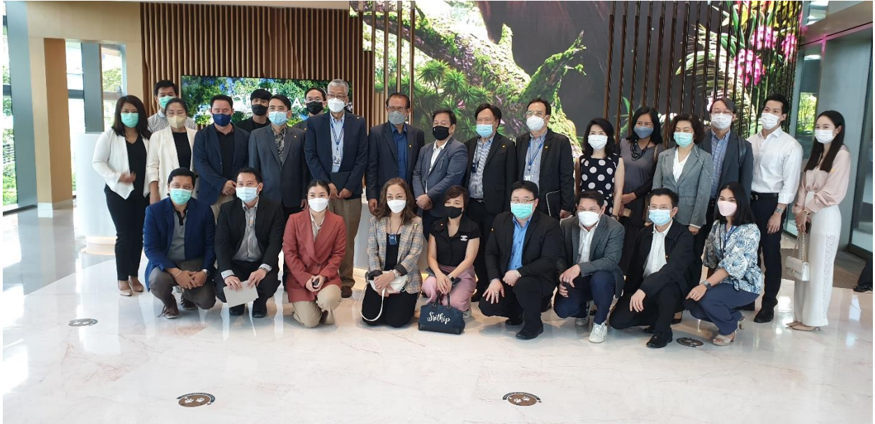
ภาพที่ 26 การเยี่ยมชมและประสานแผนกับโครงการ The Forestias บางนา