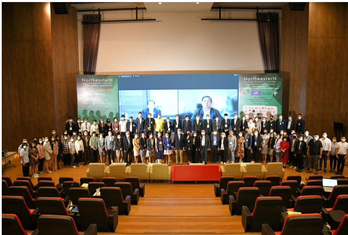
ภาพที่ 20 การประชุมใหญ่เปิดระเบียงเศรษฐกิจพิเศษภาคตะวันออก ณ อุทยานวิทยาศาสตร์ภาคตะวันออก จังหวัดขอนแก่น มหาวิทยาลัยขอนแก่น