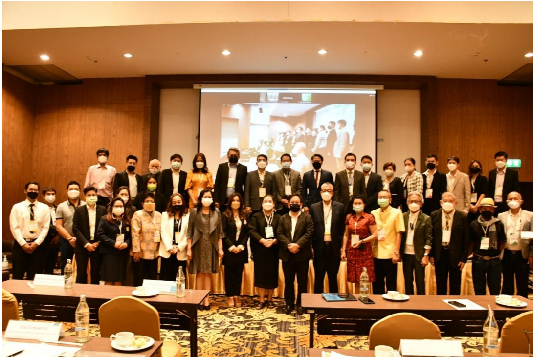
ภาพที่ 13 ภาพการประกาศความพร้อมการพัฒนาระเบียงเศรษฐกิจเวลเนสภาคกลาง