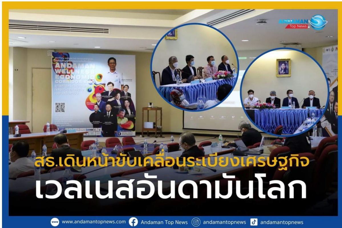
ภาพที่ 6 อธิบดีกรมสนับสนุนบริการสุขภาพบรรยายแนวทางการพัฒนาระเบียงเศรษฐกิจอาเซียนตามันต์และ ระเบียงเศรษฐกิจอาเซียนประเทศไทย ณ.วิทยาเขตภูเก็ต มหาวิทยาลัยสงขลานครินทร์

สร้างกลไกใหม่ที่มีศักยภาพในการเร่งรัดพลิกฟื้นเศรษฐกิจที่ได้รับผลกระทบอย่างหนักจากการระบาดของโควิด 19 รวมทั้ง พัฒนาระบบนิเวศของอุตสาหกรรม Welness ให้รองรับกับพฤติกรรมวิถีใหม่ของประชาชนและนักท่องเที่ยวที่ให้ความสำคัญกับการส่งเสริมสุขภาพมากขึ้น โดยอธิบดีกรมสนับสนุนบริการสุขภาพได้บรรยายกรอบคิดของ ระเบียงเศรษฐกิจอาเซียนประเทศไทยและระเบียงเศรษฐกิจอาเซียนตามันต์ที่ประชุมคณะหัวหน้าส่วนราชการ สถาบันการศึกษา และผู้บริหารกิจการ Welness พื้นที่ระเบียงเศรษฐกิจอาเซียนตามันต์ซึ่งจัดประชุมขึ้นที่วิทยาเขต ภูเก็ต มหาวิทยาลัยสงขลานครินทร์