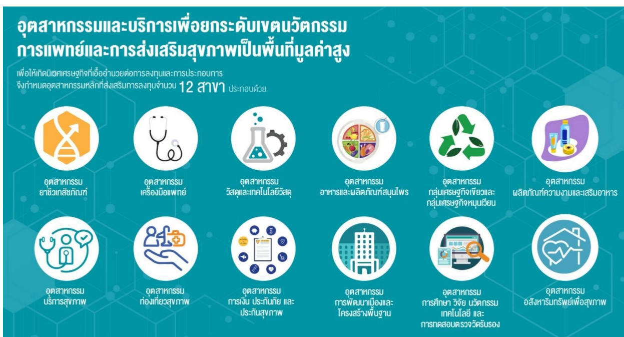
ภาพที่ 1 แสดงสาขาอุตสาหกรรมเขตพัฒนามูลค่าสูงที่ได้รับการสนับสนุนการลงทุนในพื้นที่เขตนวัตกรรมการแพทย์และการส่งเสริมสุขภาพ

เศรษฐกิจเขตพัฒนาระเบียงเศรษฐกิจเขตประเทศไทยและเขตนวัตกรรมการแพทย์และการส่งเสริมสุขภาพเพื่อเป็นกลไกพลิกฟื้นเศรษฐกิจ โดยเฉพาะอย่างยิ่ง เขตนวัตกรรมการแพทย์และการส่งเสริมสุขภาพนั้น นับเป็นพื้นที่ไฮ้แแดงที่ส่งเสริมการลงทุนอย่างเข้มข้นสำหรับอุตสาหกรรมการแพทย์ ผลิตภัณฑ์สุขภาพ พร้อมด้วยบริการที่เกี่ยวข้องกับการส่งเสริมสุขภาพ ซึ่งจากยุทธศาสตร์ที่จะกล่าวต่อจากนี้ กฎบัตรไทยได้แสดงเป้าหมายการพัฒนา แผนงานสำคัญเร่งด่วน พร้อมด้วยงบประมาณที่ภาครัฐให้การสนับสนุนการลงทุนโครงสร้างพื้นฐานเป็นปัจจัยกระตุ้นให้ภาคเอกชนลงทุนในพื้นที่ที่กำหนด โดยมีมหาวิทยาลัยที่มีความเชี่ยวชาญด้านการแพทย์และการส่งเสริมสุขภาพที่ตั้งอยู่ในพื้นที่เขตนวัตกรรมการแพทย์และการส่งเสริมสุขภาพ เป็นหน่วยบริหารจัดการร่วมกับกระทรวงสาธารณสุข หน่วยงานที่เกี่ยวข้อง และองค์กรภาคเอกชนในพื้นที่ ทั้งนี้ จากการศึกษา ได้พบอุตสาหกรรมเขตพัฒนาที่เป็นกลุ่มมูลค่าสูงจำนวน 12 สาขาที่มีศักยภาพ ควรได้รับการสนับสนุนให้ลงทุนในพื้นที่เป้าหมาย ด้วยตลาดของอุตสาหกรรมการแพทย์และการส่งเสริมสุขภาพมีการขยายตัวในอัตราสูง สามารถผลักดันให้เกิดนิเวศการผลิตและบริการที่เชื่อมโยงกัน เพิ่มการสร้างงานและเกิดการกระจายรายได้สู่ภาคเศรษฐกิจในทุกระดับ